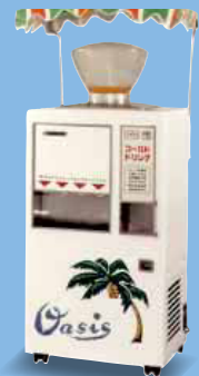
今から45年ほど前に日本で大流行した噴水型のジュース自販機。

今のようにいろいろな用途の自販機が登場するようになったのは、1800年代後半、産業革命後のイギリスでした。飲料や菓子・食品、チケット、タバコなどの自販機が実用化され、基本的な技術も、そのころに開発されました。その後、大きな2つの戦争を経て技術大国となったアメリカで、自販機の技術や用途は飛躍的に発展しました。